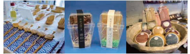
BEPPU PROJECTの企画運営店舗「SELECT BEPPU」では、生産者と共同開発した多くの商品が並ぶ。中央のざぼん漬はリデザインしたことにより数倍の利益を拡大。別府市内外でも好評の人気商品。