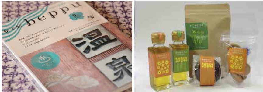
左・旅手帖beppu/20代～30代の女性をターゲットにした情報誌、散策マップ、Webサイトを制作。B5版、200p。2012年は全国で5万冊程度無料配布、インターネットで300万人以上に情報が拡散。フリーマガジンの人気ランキング3位(2011年) 右/国東半島芸術祭の関連商品としてリパッケージした、国東半島の特産品を用いた商品

ただし、試作品制作、パッケージング等を含む商品開発費用はメーカー・生産者様のご負担となります。